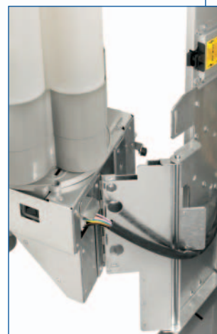
Cerniera con doppio snodo per consentire un'apertura a 180° e quindi un'ottima accessibilità interna anche in batteria