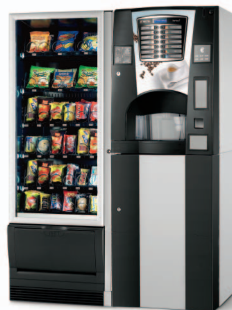
Possibilità di installazione con Snakky e Snakky SL usando il kit rialzo.