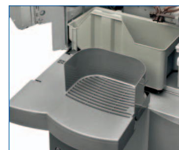
Bacinelle fondi liquidi e solidi perfettamente bilanciate