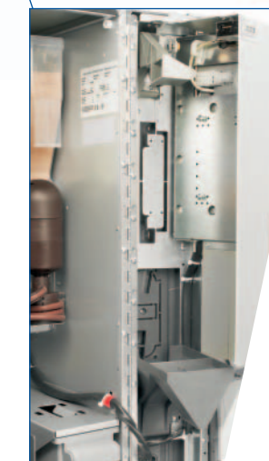
Vano protetto e aperto per i sistemi di paga Gettoniera rendiresi o validatore installabile con sistema cashless.