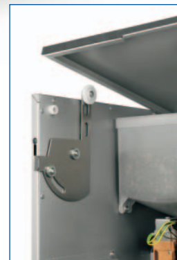
Chiusura distributore non possibile a cielo aperto